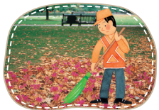
공원 쓰레기를 치운다.