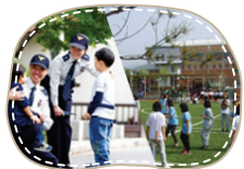
학교, 경찰서 등을 만든다.

우리가 내는 세금으로 나라에서는 어떤 일들을 하나요? 맞는 것에 'O' 표, 틀린 것에 'X' 표를 해주세요.